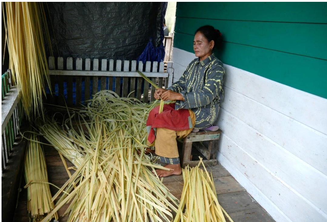
Gambar Peranan Perempuan Desa Perigi Raja

Perempuan – perempuan pada Desa Perigi Raja rata – rata berprofesi sebagai Ibu Rumah Tangga (IRT) yang mana juga turut andil dalam mendukung kegiatan perekonomian rumah tangga. Disamping mengurus rumah tangga sebagai bentuk peran perempuan dalam norma tradisi dan agama, perempuan Desa Perigi Raja melakukan kegiatan produktif disela-sela waktu seperti melakukan keterampilan menjahit, produksi makanan ringan, pengolahan pucuk nipah dengan memisahkan daun pucuk dari lidi dan di ikat sebelum dilakukan penjemuran, juga membantu suami dalam memilah hasil tangkapan laut, panen kelapa dan pembuatan arang bakau. Selain itu membuat kerajinan anyaman juga dilakukan oleh kaum perempuan di Desa Perigi Raja, hal ini memang belum menjadi sesuatu yang di khususkan sebagai bentuk proses utama dalam perekonomian.