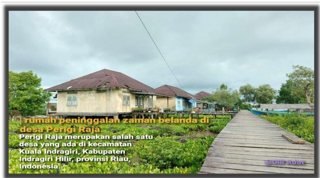
Gambar Rumah Peninggalan Belanda

Pada tahun 1706 dimasa VOC didirikanlah fasilitas pabean (bea cukai) dengan fasilitas gudang garam yang memegang pusat perkantoran yang berasal dari Desa Perigi Raja dibawah komando kepemimpinan kolonial Belanda. Masa kepemimpinan kolonial Belanda berakhir pada tahun 1965, sehingga pada tahun inilah roda pemerintahan kembali kepada Pemerintahan Negara Kesatuan Reublik Indonesia (NKRI).